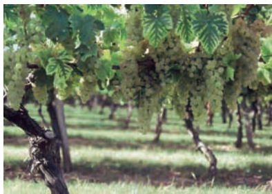
Sur les coteaux qui entourent la ville, les chassellatiers continuent de prendre le plus grand soin de leurs vignes et des grappes. Chasselas de Moissac.

Les savoirs et pratiques vernaculaires se sont construits à partir de l'expérience acquise et de l'observation. Ils coexistent avec les savoirs scientifiques et techniques qui les pénètrent plus ou moins selon les