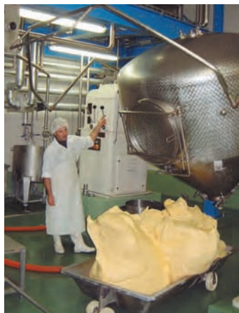
Fabrication du beurre de baratte à la Laiterie coopérative d'Étrez-Beaupont, Bresse, Ain, 2004

L'élaboration d'un produit est le résultat d'une succession de savoir-faire plus ou moins complexes, dont certains occupent une place déterminante ou requièrent une compétence particulière qui aide à la caractérisation de sa spécificité. Elles ne sont pas indispensables au déroulement du processus, contrairement à ce qui se passe dans une logique strictement technique, mais leur absence peut faire perdre au produit sa typicité. Ainsi, dans la fabrication de la rosette, le boyau naturel continue d'être utilisé par de nombreux artisans car c'est un élément central caractérisant la spécificité de ce saucisson. Il impose un travail de préparation important, mais l'épaisseur de sa paroi autorise un affinage