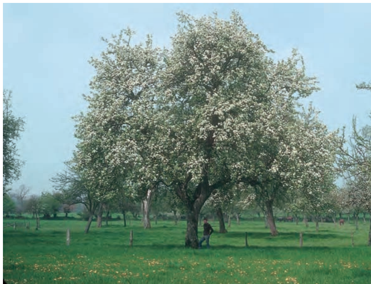
Pré verger et variétés locales constituent les éléments centraux de la production cidricole en Normandie. Poiriers à poiré dans le Domfrontais, berceau du poiré Domfront et du calvados Domfrontais, tous deux AOC. Saint-Roch-sur-Egrenne, Orne, 1985.