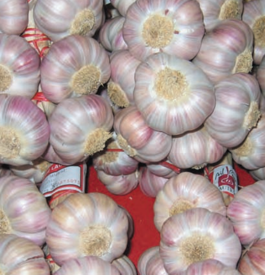
L'ail de Lautrec, présenté en « manouilles », Indication géographique protégée depuis 1996.