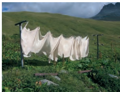
Les toiles qui servent à fabriquer le bleu de Termignon sèchent au vent des Alpes...