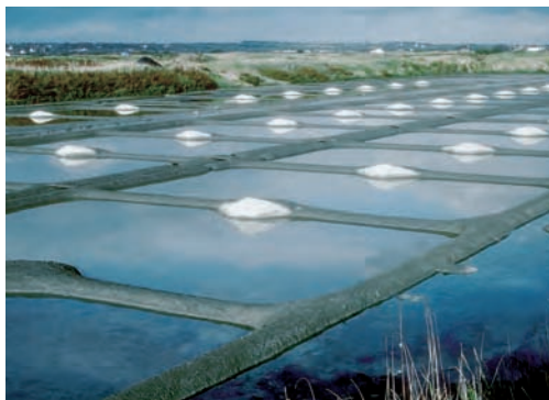
Le sel est considéré comme produit industriel par l'Union européenne et ne peut pour l'instant bénéficier de la protection de l'Indication géographique. Marais salant de Guérande, 1987.

Plus que l'ancrage historique, ce sont les savoir-faire collectifs qui constituent le critère le plus opérationnel pour rendre compte de la nature du lien. Le Bleu de Bresse – marque déposée – bénéficie déjà d'une certaine antériorité puisqu'il est fabriqué dans l'Ain depuis une soixantaine d'années ; mais il ne repose pas sur des pratiques partagées localement : il est le fait d'un directeur de coopérative particulièrement dynamique et inventif qui a mis au point ce fromage dans l'après-guerre. On peut en dire autant des créations des pâtisseries et des confiseurs.