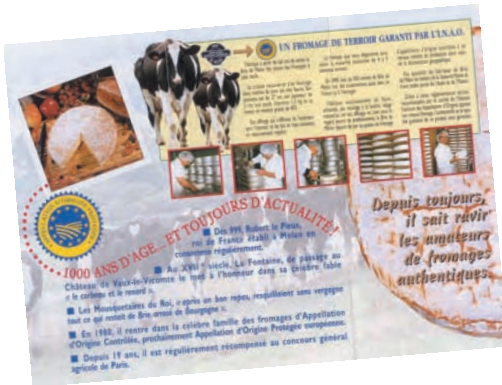
Un brie hors d'âge...

hasard, l'erreur, la légende et des personnages célèbres de toute espèce. L'origine est souvent « ancestrale », date de la « nuit des temps » ou renvoie à la légende, volontiers imprégnée de hasard. Le roquefort vit le jour grâce à un berger ayant précipitamment quitté la grotte où il se trouvait en laissant un quignon de pain et un morceau de fromage. Quelque temps plus tard, il retrouva un fromage devenu bleu et goûteux, raconte l'histoire.