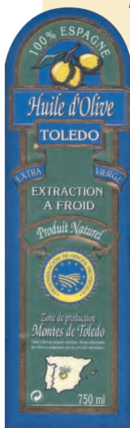
Les AOP commencent à circuler en Europe. Etiquette d'une huile d'olive d'Espagne.

des qualités particulières. Elle n'impose pas une zone unique où doit se dérouler l'ensemble des opérations : les matières premières en particulier peuvent provenir d'ailleurs.