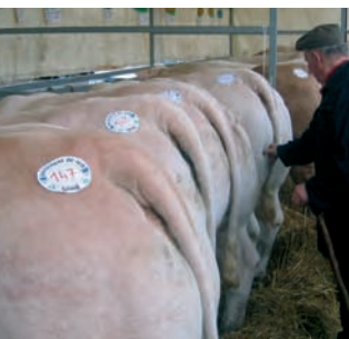
L'évaluation de l'état d'engraissement du bœuf de Charolles se fait en touchant une zone particulière de la bête. Concours de bovins charolais à Roménay, Saône-et-Loire, 2006.

Autre exemple : contrairement à ce qui se passe dans le mode industriel de fabrication du beurre, toutes les crèmes destinées à faire le beurre en Bresse subissent au préalable une maturation biologique qui leur permet de développer leurs arômes. Ceci est un des points de caractérisation les plus importants. Une fois maturée, la crème est rapidement transformée et l'on veille à limiter les manipulations pour lui conserver toutes ses qualités, un soin qui traduit une culture partagée du produit.