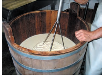
Le salers, fromage fermier AOC, se fabrique d'avril à novembre. Le caillage a lieu dans une gerle en bois. Région d'Aurillac, Cantal, 2006.

La transmission – ici dans le cadre de l'apprentissage – peut s'effectuer par l'intermédiaire d'acteurs occupant une place spécifique dans la société locale ou dans la famille. La transmission peut être relayée par d'autres maillons, en fonction de la recomposition des sociétés rurales, en particulier dans les milieux les plus difficiles qui souffrent souvent de désertification et sont plus perméables