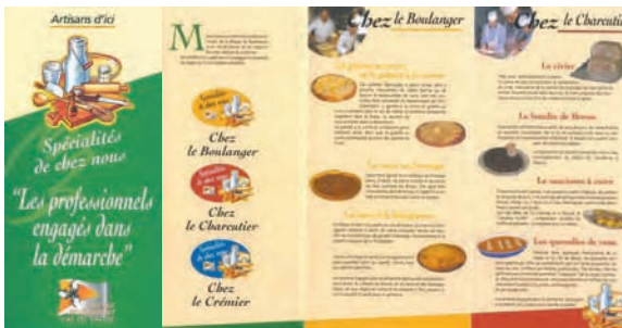
Dépliant, un des éléments du matériel de communication.