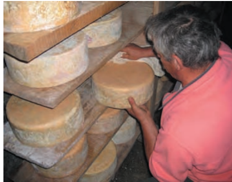
Sur l'alpage d'Entre deux eaux, en Vanôise : cave d'affinage pour le bleu de Termignon, Savoie, 2005.

Toutefois, la prise en compte de cette diversité se heurte aux effets de la mondialisation. En effet, l'internationalisation des échanges associée à la libre circulation des biens génère et impose des normes de plus en plus contraignantes. Ces règles ont été conçues pour des productions industrielles et prennent très peu en compte, ou au coup par coup, les caractéristiques liées aux petites unités de fabrication et aux productions locales. Il importe, pour leur survie, de réfléchir à des normes adaptées à leur spécificité et à des unités de fabrication de petite taille. Si l'obligation de résultat est indiscutable – il ne s'agit pas de mettre sur le marché des produits dangereux pour la santé – une interprétation raisonnée et raisonnable des textes devrait permettre aux opérateurs de conserver leurs savoir-faire.