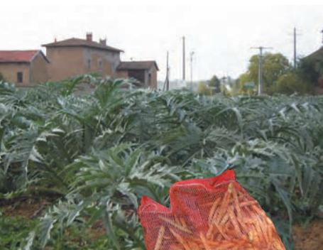
Deux légumes emblématiques d'un lieu : le cardon de la région lyonnaise et le coco de Paimpol AOC en Bretagne.

Ce dispositif, s'il est bien adapté à la création actuelle et aux obtentions récentes, pose problème dès lors que l'on a affaire à des types locaux, qui peuvent être « trop » hétérogènes et subir des variations au sein d'un ensemble. Les critères mêmes de DHS obligent à une réflexion sur ce qui identifie la variété ou la population locale utilisées pour la production sous signe de qualité ou d'origine. Toute fixation de l'assortiment variétal ou des populations dans un cahier des charges peut conduire à une forme d'appauvrissement par rapport à un état de référence. D'un autre côté, il serait utopique de vouloir tout conserver. Il s'agit par conséquent de