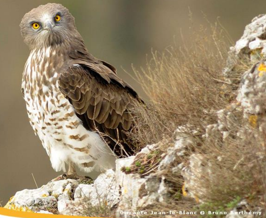
Circaète Jean-le-Blanc