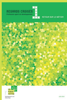
Le 1 er numéro de Regards Croisés invite à un "Retour sur le métier" d'agent de développement.

Une évaluation externe confirme l'intérêt et la pertinence de l'action de la Plate-Forme. Elle propose plusieurs pistes d'évolution (gouvernance, organisation interne, financement, etc.) pour s'adapter aux évolutions en cours dans les territoires.