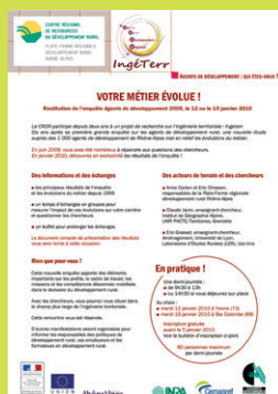
L'enquête de 1999 sur les agents de développement est réactualisée. Elle donne lieu à plusieurs journées de réflexion avec les professionnels.

L'émergence du concept d'ingénierie territoriale nécessite une réflexion approfondie sur la place des agents de développement dans cette ingénierie : la Plate-Forme assure le montage et la conduite du programme de recherche IngéTerr (PSDR3) en partenariat avec plusieurs laboratoires rhônalpins.