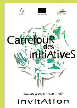
Mai 1997, 400 acteurs (agents, élus, porteurs de projet) se retrouvent au Carrefour des initiatives à Pélussin (Loire).

Le CRDR noue des partenariats au niveau régional (ARADEL, CR-DSU, CAUE, universités, etc.) et national (Collectif Ville-Campagne, ETD, Source, etc.). Il se rapproche des Sites de proximité pour l'emploi et la création d'activités pour valoriser les expériences rhônalpines, montrer les potentiels de développement de l'espace rural et offrir de nouveaux services aux agents.