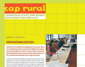
Au sommaire du n°1 de Cap Rural : Entre ingéniosité et ingénierie, le point sur les résultats de l'enquête IngéTerr sur les agents de Rhône-Alpes.

Deux nouvelles missions sont créées : l'impulsion pour la création d'activités en explorant les potentiels des territoires ; l'accompagnement des agents dans la gestion de leur carrière et de leurs employeurs dans la définition des profils des postes.