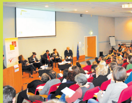
Novembre 2012 : La première édition d'Innov'Rural réunit 134 agents, techniciens et élus autour du thème Pour un rural compétitif.