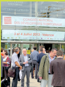
Valence, 3 et 4 juillet 2013 : 400 personnes venues de toute la France participent au 1 er congrès national des développeurs territoriaux.

La Plate-Forme s'associe à l'UNADEL, au Collectif Ville-Campagne et à l'IRDSU pour organiser le 1 er congrès national des développeurs territoriaux et remédier ainsi à l'absence d'espace national de dialogue sur les métiers du développement.