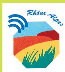
Le premier logo du CRDR.

L'État et la Région Rhône-Alpes créent le Centre régional de ressources du développement rural (CRDR) pour rompre l'isolement géographique et le cloisonnement professionnel des agents de développement. Deux personnes sont recrutées et proposent les premiers services : revue de presse, fonds documentaire, formations et appui méthodologique.