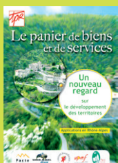
Le Panier de biens et de services : quand la recherche universitaire rencontre les territoires (formation et guide méthodologique sur les produits du terroir).

Naissance de la Plate-Forme régionale développement rural Rhône-Alpes, qui réunit le CRDR et les Sites de proximité pour l'emploi et la création d'activités. La synergie qui en résulte renforce les services aux porteurs de projets et aux professionnels du développement en matière de professionnalisation et de création d'activités.