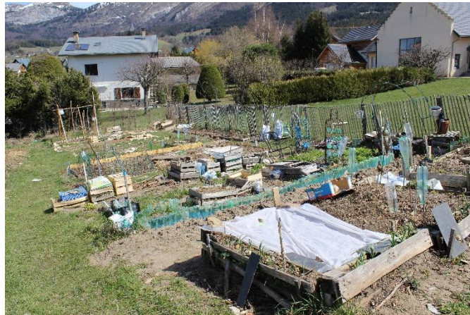
Jardin partagé du centre social, Vercors (Vandembroucke, avril 21)