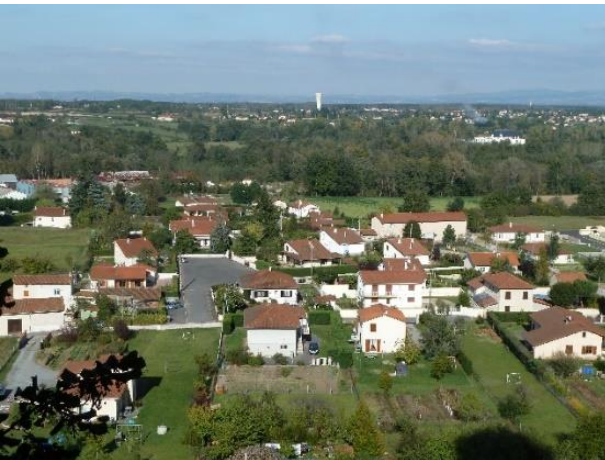
Jardins de lotissements (C. Delfosse, Forez)