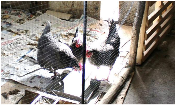
Poules grises du Vercors (Vandenbroucke, avril 21)

Pratiques jardinières et enjeux de protection des ressources (eau,..) Implication pour la biodiversité sauvage (pollinisateurs, oiseaux..)