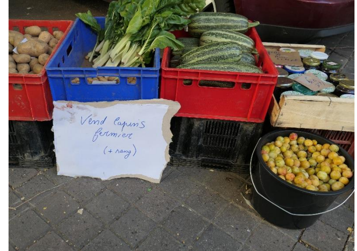
Vente de surplus de jardin. Marché du Puy