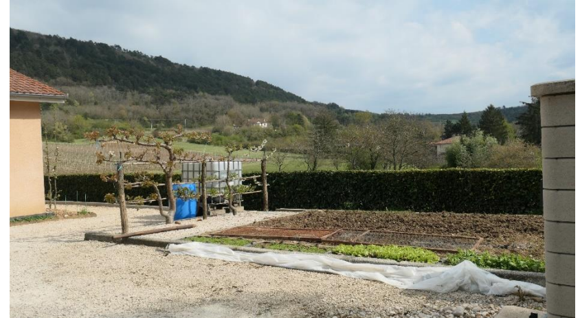
Entre décor et praticité jardin de maison neuve individuelle Bourg périurbain . Jardin au pied de la maison. Ain C. Delfosse