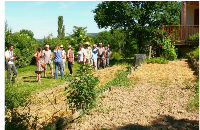
Animation autour du jardin dans le Velay. CPIE