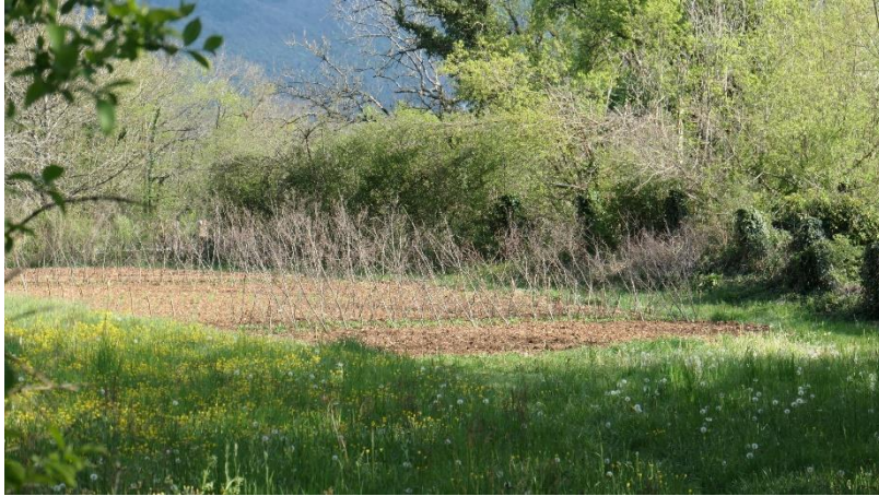
Jardin au milieu d'un pré, en face des habitations(revermont, Ain C Delfosse)

Sur du foncier public ou privé... une place réservée dans l'urbanisme ou nichés dans les interstices?