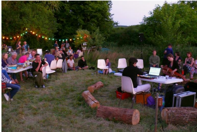
Animation culturelle autour du jardin dans le Velay. CPIE