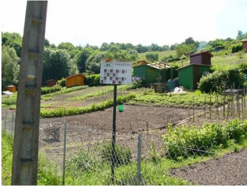
Jardins Volpette (G. Chorgnon, Pilat)