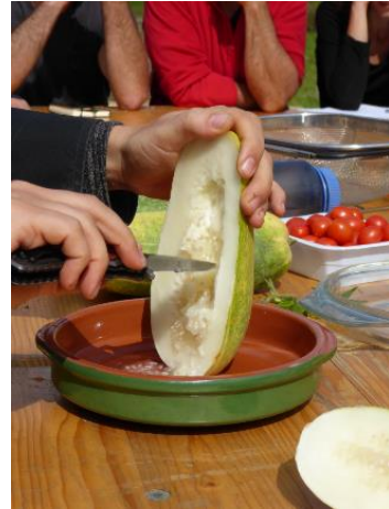
Formation « graines » PNRC