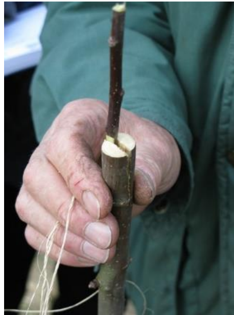
Démonstration de greffe (S. Ala)