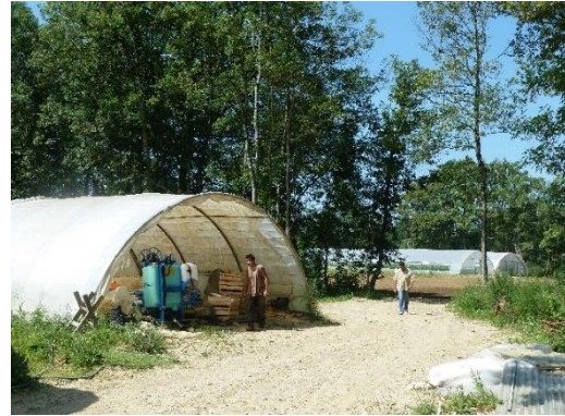
Jardin de Cocagne (C. Delfosse, Bresse)