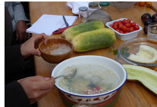
Clichés PNR Chartreuse