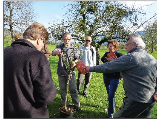
Cours de taille, journée taille-greffe, 12 avril 2014, Saint Jorioz